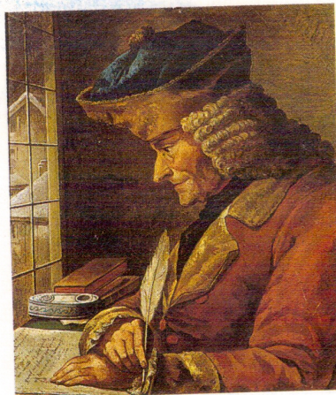
1. Voltaire (1694-1778). Peinture anonyme, Paris, musée Carnavalet.

Cette atmosphère de bouillonnement intellectuel (doc.7) et la volonté de renouvellement politique vont agiter la fin du XVIII e siècle.