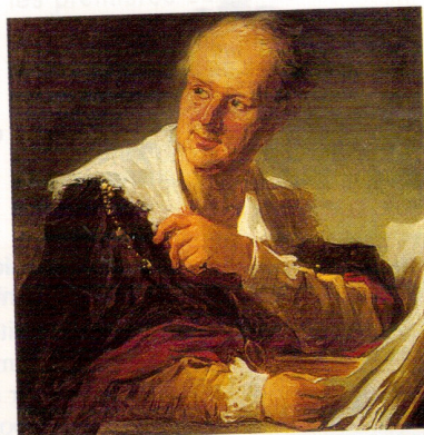
2. Denis Diderot (1713-1784). Portrait par Fragonard, Paris, musée du Louvre.