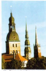
21. Домський собор та церква св. Петра