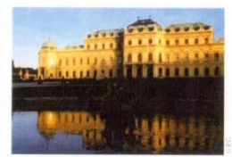
13. Бельведерський замок