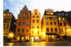
16. Ринкова площа старої частини Стокгольму