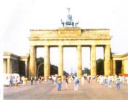
1. Бранденбурзькі ворота