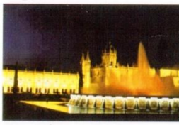
12. Монастир двох Іскронів