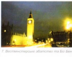
7. Вестмінстерське абатство та Біг Бен