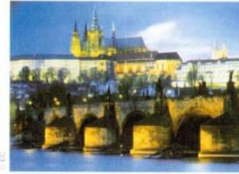
18. Карловий міст