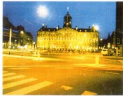
6. Королівський палац країни тюринів