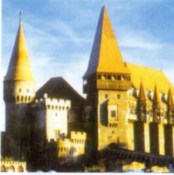
24. Замок у місті Хунедоара