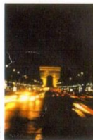
3. Єлісейські поля та Триумфальна арка