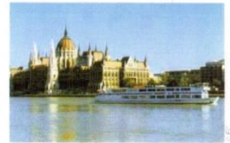
17. Парламент держави-члена ЄС з 2004 року