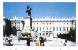
11. Королівський палац - резиденція Хуана Карлоса II