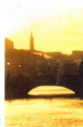
8. Міст О'Коннела