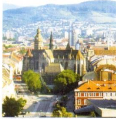
23. Собор Св. Єлизавети в Кошице