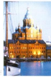
14. Успенський Собор