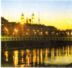
22. Центральна частина міста на Вільні