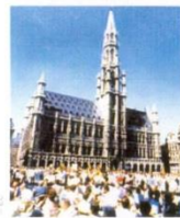
4. Муніципалітет в місті - серці ЄС