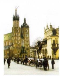
15. Ринкова площа культурної столиці західного сувіда України