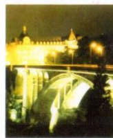
5. Адольфіє міст у найменшому Великому герцогстві ЄС