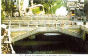
20. Тромстов'є в місті Фракна