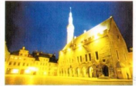
19. Муніципальна площа однієї з прибалтійських держав